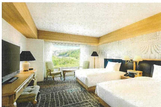
客室：ゲストルーム（ツイン）

URL： https://www.hilton.com/ja/hotels/toytahi-hilton-takayama-resort/