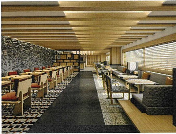
エグゼクティブラウンジ