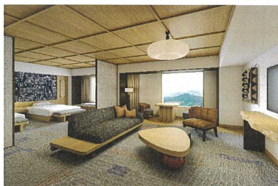
客室：プレミアムスイート